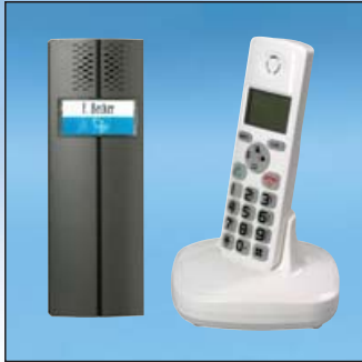
FUNK-TÜRSPRECHANLAGE TF 03 SET

Diese Türsprechanlage bietet Sicherheit und Komfort ohne Installationsaufwand. Die elegante Türsprechstelle wird einfach aufputz durch zwei Schrauben an die Wand montiert. Die Kommunikation nach innen zum tragbaren Mobilteil erfolgt über Funk.