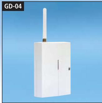
GSM-WÄHL UND STEUERGERÄT GD-04 SET

Das benutzerfreundliche und universell einsetzbare GSM Wählgerät GD-04 wurde konzipiert, um sich im Alarmfall benachrichtigen zu lassen oder Anwendungen aus der Ferne zu Steuern. Wird einer der 4 Eingänge aktiviert, so sendet das Gerät eine SMS und/oder einen Anruf an bis zu 8 programmierbare Telefonnummern. Das GD-04 verfügt zusätzlich über 2 Ausgänge, die per SMS oder Anruf aus der Ferne geschaltet werden können. Dabei können bis zu 50 Telefonnummern pro Ausgang zur kostenlosen Steuerung (unbeantworteter Anruf) autorisiert werden. In Verbindung mit dem optionalen Funkmodul GD-04R können diverse Melder und Bedienelemente des Funk-Alarmsystems System 8000 am GD-04 angemeldet werden um Anwendungen zu steuern oder Personen zu benachrichtigen. Mittels der im Set beinhaltenen USB-Schnittstelle mit Software (GD-04P) kann das Gerät sehr komfortabel mit Hilfe eines Computer programmiert werden. Außerdem kann das GSM Wählgerät über das Internet oder SMS Befehle konfiguriert werden.